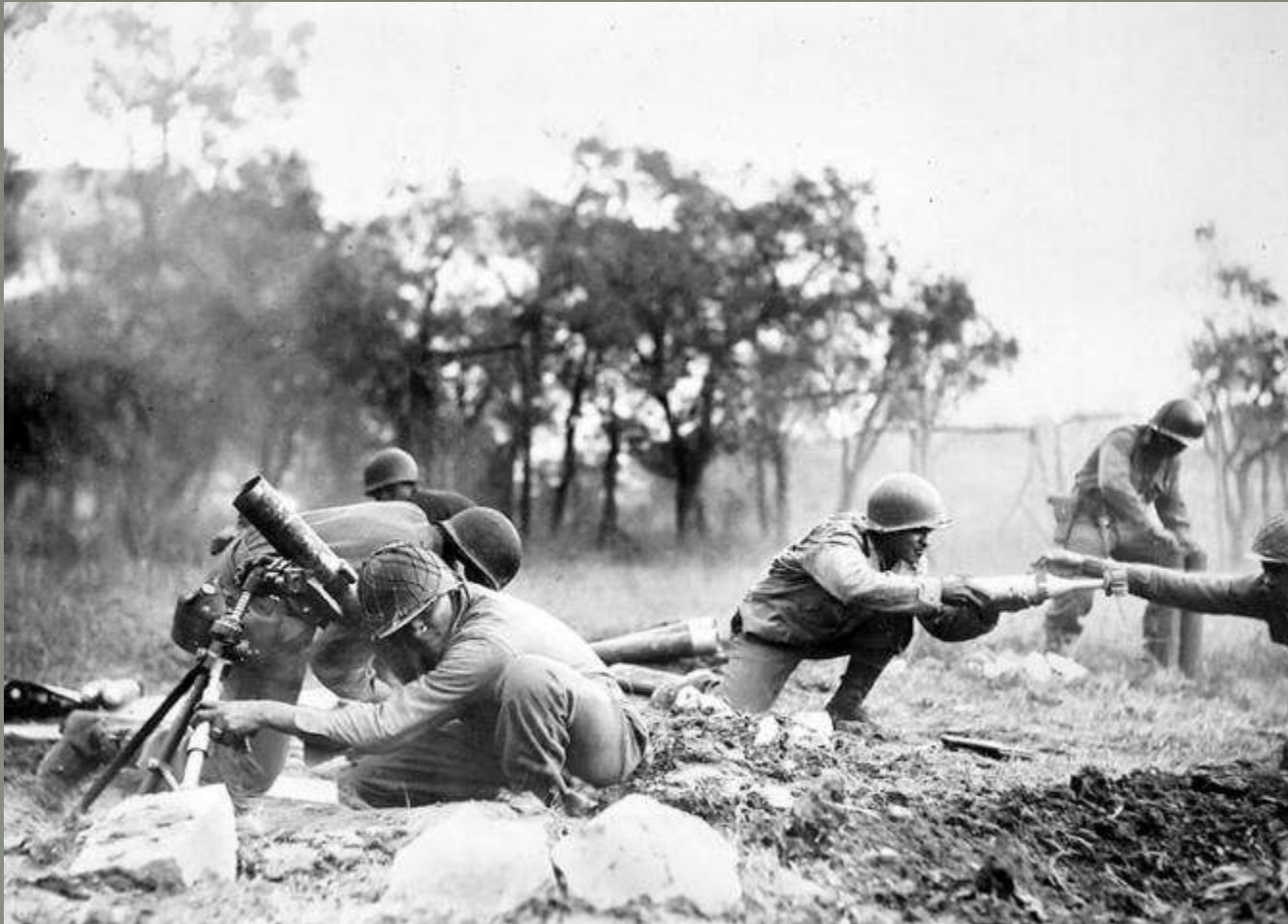
Reparti della FEB in azione